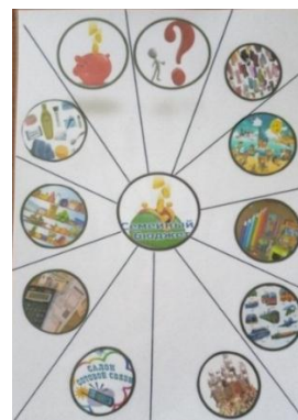
Карточки для моделирования семейного бюджета на месяц.