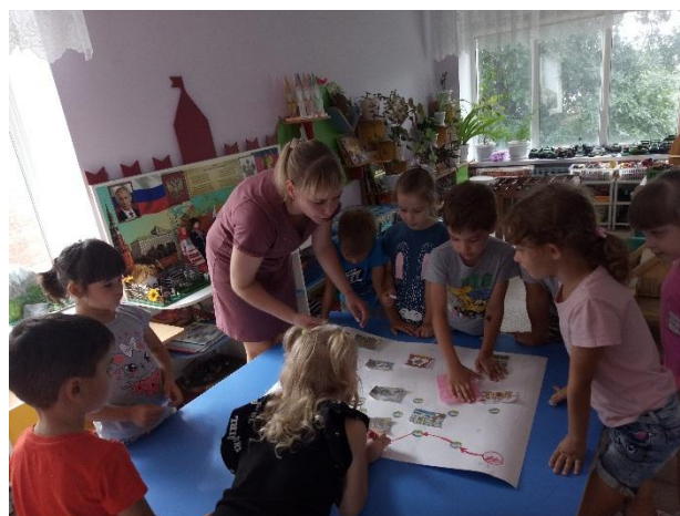
Игра "Бюджетная ходилка"