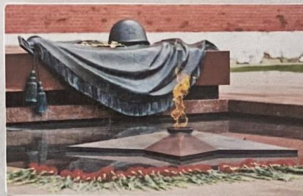
«Могила неизвестного солдата» г. Москва