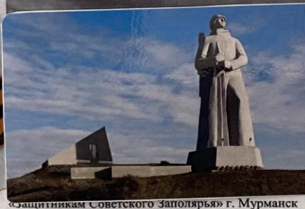
«Защитникам Советского Заполярья» г. Мурманск