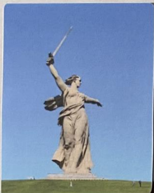
«Родина-мать зовёт» г. Волгоград