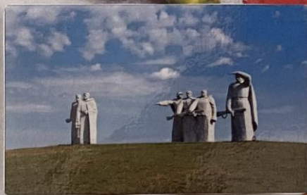
Мемориал «Героям панфиловцам»