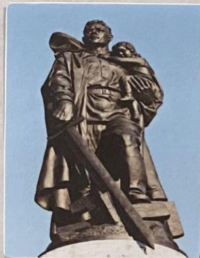
«Воин - освободитель» г. Берлин