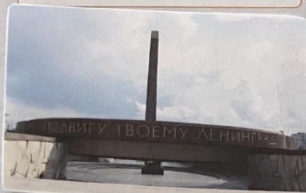
Монумент «Героическим защитникам Ленинграда»